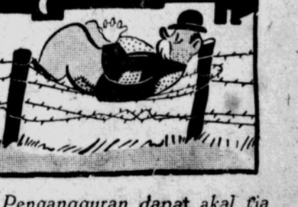
Pengangguran dapat akal tjari tempat lalok.